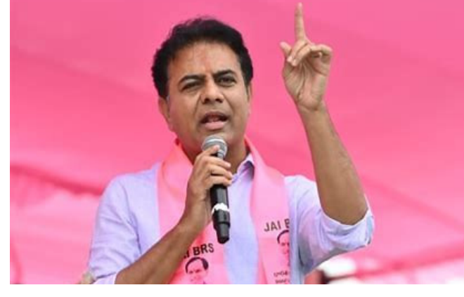
చేతులు ఊపుతూ.. కాలు కింద పెట్టుకుండా అటు ఇటు తిరిగి వెళ్లిపోయాడని వ్యంగ్యంగా అన్నారు.

అధికారంలోకి వచ్చిందని జిఆర్ఎస్ పార్టీ వర్కింగ్ ట్రైనింగ్ కేటీఆర్ మండ్రించారు. ప్రజలకు కష్టం వస్తే జిఆర్ఎస్ నాయకులు గులాబీ దండం ఏదాని కాలంగా వారికి ఆండగా ఉందని స్పష్టం హైదరాబాద్ నుంచి కూకట్ పల్లి దూరానికి కూడా హెలికాప్టర్లో