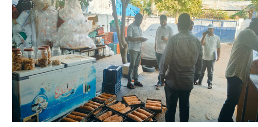
సెంటర్ మరియు వాటర్ ప్లాంట్ మొదలగు వంటి ఐదు (5) వ్యాపార