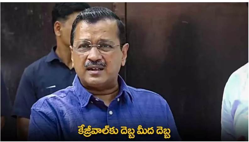
కేజ్రీవాలకు దెబ్బ మీద దెబ్బ

ధీర్ఘ లిక్కర్ పాలన స్ఫూర్తి అరణ్యం ధీర్ఘ సీఎం కేజ్రీవాల కు కోర్టులో వరుస ఎదురుదెబ్బలు తగులుతున్నాయి. ఈడీ తరఫు న్యాయవాది తన వాదనలు వినిపించారు. "కేజ్రీవాల బెయిల్ వ్యతిరేకించేందుకు తమకు సరైన అవకాశం లభించలేదు. మా వాదనలు వినిపించే సరిపడా సమయము ఇవ్వలేదు. (బ్రయల్ కోర్టు ఉత్తర్వులపై స్టే విధించాలి. మా పిటిషన్ పై అత్యవసర చర్యలు చేపట్టాలి..." అని కోరారు. ఈ నేపథ్యంలో హైకోర్టు ఈ స్టే ఇచ్చింది. (బ్రయల్ కోర్టులో విచారణ కార్యకలాపాలను కూడా నిలిపివేస్తున్నట్లు హైకోర్టు న్యాయమూర్తులు జస్టిస్ సుధీర్ కుమార్ జైన్, జస్టిస్ రవీందర్ దూబేజాలతో కూడిన నదిపివేస్తున్నట్లు చేసింది. బెయిల్ ను సవాల్ చేస్తూ ఈడీ దాఖలు చేసిన పిటిషన్ ను తాము విచారించే వరకు (బ్రయల్ కోర్టు ఆదేశాలు అమలు కావని తెలిపింది. విచారణ పూర్తయ్యే వరకూ ధీర్ఘ సీఎం కేజ్రీవాల జైలులోనే ఉంచాలి. వ్యాపానికీ శుక్రవారం కేజ్రీవాల తీవ్ర జైలు నుంచి విడుదల కావాలి ఉంది. ఈలోగా ఈడీ పిటిషన్ సాక్షులను వేయడం దానికనుగుణంగా హైకోర్టును స్టే ఇవ్వడంతో సీన్ రివర్స్ అయింది. మూడు నెలల కిందట అరణ్యయన కేజ్రీవాల కు రౌన్ ఆవెస్కా కోర్టు బెయిల్ మంజూరు చేసింది. రూ. లక్ష వ్యక్తిగత పూచీకత్తును సమర్పించాలని, దర్యాప్తుకు అటంకం కలిగించొద్దని, విచారణకు సహకరించాలని, ప్రభావితం చేయొద్దని, పిలిచినపుడు కోర్టుకు రావాలని పలు షరతులు విధించింది. ఐతే.. 48 గంటల పాటు బెయిల్ ఆర్డర్ ను నిలిపివేయాలని ఈడీ విజ్ఞప్తి చేసింది.