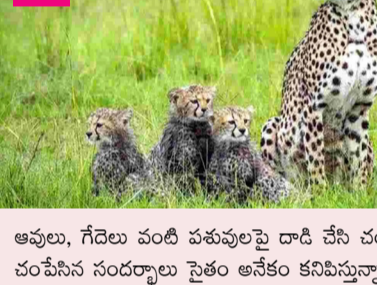
అవులు, గేదెలు వంటి పశువులపై దాడి చేసే చంపేస్తున్నాయి. మనుషులపై దాడి చేసే గాయపరిచిన, చంపేసిన సంఘటనలు సైతం అనేకం కనిపిస్తున్నాయి.

కడప: తెలంగాణ రాష్ట్రంలో చిరుత పులులు పెద్దపులుల సంచారం పెరిగిపోయింది. అడవులు తగ్గిపోవడం, అహారం లభ్యత తగ్గడంతో ఈ వన్యమృగాలు జనావాసాల్లోకి వస్తున్నాయి. మరోవైపు చిరుతల సంకతి కూడా బాగా పెరిగినట్లు అటవీ శాఖ అధికారులు చెబుతున్నారు. అహారం కోసం గ్రామాల్లోకి వస్తున్న అడవి మృగాలు అవులు, గేదెలు వంటి పశువులపై దాడి చేసే చంపేస్తున్నాయి. మనుషులపై దాడి చేసే గాయపరిచిన, చంపేసిన సంఘటనలు సైతం అనేకం కనిపిస్తున్నాయి.