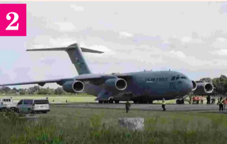
న్యూఢిల్లీ: అగ్రరాజ్యం అమెరికాలో అక్రమ వలసలపై ట్రంప్ సర్కార్ కఠిన చర్యల్లో భాగంగా భారత్ కు చెందిన 104 మందిని స్వదేశానికి పంపింది. భారతీయులతో కెన్యాకు నుంచి బయలుదేరిన యూఎస్ మిలటరీ సీ-17 ట్రాన్స్పోర్ట్ ఎయిర్క్రాఫ్ట్ బుధవారం మధ్యాహ్నం మంజూర్ లోని అమ్మకాన్ అంతర్జాతీయ విమానాశ్రయానికి చేరుకుంది. వీరంతా, పంజాబ్, చుట్టూపక్కల రాష్ట్రాలకు చెందిన వారిగా తెలుస్తోంది.