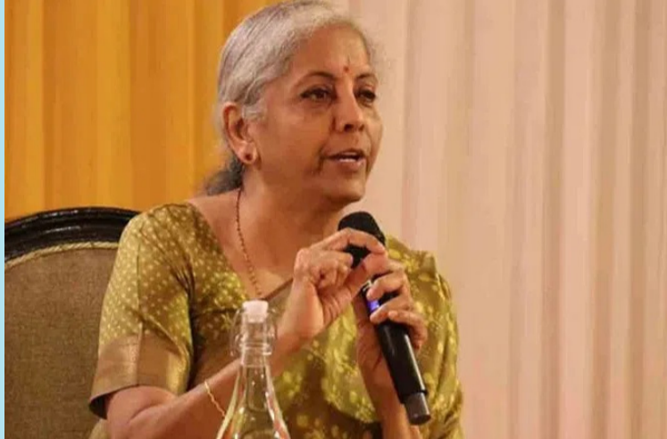
న్యూఢిల్లీ : మార్చి15(మరో ఉదయం)

ఎన్నికల బాండ్లపై స్టంబించిన ఆర్థిక మంత్రి