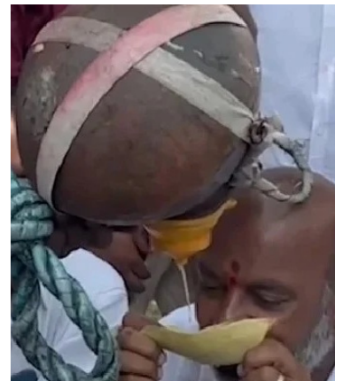
తన ప్రజాహిత యాత్రలో ఓ గ్రామంలో ఓ గౌడన్న కల్లు పోస్తే బండ్లి సంజయ తాగారు. ఆ గౌడన్నను ఆప్యాయంగా పలకరించి ఇందుకు సంబంధించిన వీడియోను బండ్లి సంజయ ఎక్స్ వేదికగా పోస్ట్ చేశారు. 'కల్లు పోసిన మీ ఆప్యాయత... కళ్ల నిండా పొంగిన ప్రేమ... జీవితమంతా మరువలేనిది... గౌడన్నల గుండెలో నాకున్న స్థానం కాపాడుకుంటా... కదదాకా కృతజ్ఞతతో ఉంటా...' అని ట్వీట్ చేశారు.

కేంద్ర, రాష్ట్ర ప్రభుత్వాల మధ్య మంచి సంబంధాలు ఉండాలన్న బండ్లి సంజయ భవిష్యత్తులోను ముఖ్యమంత్రి రేవంత్ రెడ్డి ఇదే పంధాను కొనసాగించాలని సూచన కాంగ్రెస్ పాత్ర ప్రసక్తే లేదని తేల్చి చెప్పిన జిజీవీ నేత ఓ గ్రామంలో కల్లు తాగిన బండ్లి సంజయం.. తెలంగాణ రాష్ట్రం కోసం ముఖ్యమంత్రి రేవంత్ రెడ్డి... ప్రధాని నరేంద్ర మోదీని కలిస్తే తప్పేమిటని బీజేపీ జాతీయ ప్రధాన కార్యదర్శి, కరీంనగర్ ఎంపీ బండ్లి సంజయ ప్రశ్నించారు. కరీంనగర్ లోకే సభ పరిధిలోని కేవలపట్నంలో ఆయన ప్రజాహిత యాత్ర నిర్వహించారు. ఈ సందర్భంగా మాట్లాడుతూ... కేంద్ర, రాష్ట్ర ప్రభుత్వాల మధ్య మంచి సంబంధాలు ఉండాలన్నా. భవిష్యత్తు లోను ముఖ్యమంత్రి రేవంత్ రెడ్డి ఇదే పంధాను కొనసాగించాలని సూచించారు. అదే సమయంలో కాంగ్రెస్, బీజేపీ పాత్ర వారలపై స్పందించారు. పాత్ర ప్రసక్తే లేదని తేల్చి చెప్పారు.