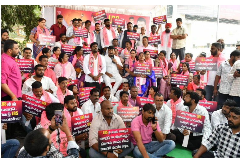
హైదరాబాద్, మార్చి 6 (మరో ఉదయం):

ఎల్ఆర్ఎస్ ఉచితంగా అమలు చేయాలని డిమాండ్ చేస్తూ విపక్ష బిఆర్ఎస్ ఆందోళనకు దిగింది. గతంలో ఎల్ఆర్ఎస్ పద్దు, భూములను ఉచితంగా క్రమబద్ధీకరిస్తామన్న కాంగ్రెస్ పార్టీ నేడు మాట తప్పడంపై బిఆర్ఎస్ క్రైబలు భగ్గుమన్నాయి.. నాడు ఆర్డర్లుగా మాట్లాడిన నేటి కాంగ్రెస్ మంత్రులు, ఇప్పుడు నోరు ఎందుకు విప్పడం లేదని ఆగ్రహం వ్యక్తం చేస్తున్నారు. ఎల్ఆర్ఎస్ అంటే ప్రజల నుంచి దబ్బులు దోచుకోవడమే అన్న కాంగ్రెస్