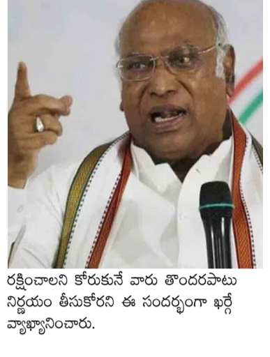
రక్షించాలని కోరుకునే వారు కొందరపాటు నిర్ణయం తీసుకోవడం ఈ సందర్భంగా ఖర్గే వ్యాఖ్యానించారు.

చెప్పారు. అయితే, నితీష్ మనసులో ఏముందో తనకు తెలియదని అన్నారు. రేపు ఢిల్లీ వెళ్లి పూర్తి సమాచారం తెసుకుంటానని చెప్పారు. రానున్న రోజుల్లో ఏం జరుగుతుందో చూద్దాం అంటూ వ్యాఖ్యానించారు. ఇక కూటమిలో అందరినీ ఏకం చేసేందుకు కాంగ్రెస్ పార్టీ శాయశక్తులా ప్రయత్నిస్తోందని ఈ సందర్భంగా మల్లికార్జున ఖర్గే పేర్కొన్నారు. తృణమూల కాంగ్రెస్ అధినేత, పశ్చిమబెంగాల్ ముఖ్యమంత్రి మమతా బెనర్జీ, సీపీఎం ప్రధాన కార్యదర్శి సీతారాం ఏచూరితో తాను మాట్లాడినట్లు చెప్పారు. రాబోయే లోక్ సభ ఎన్నికల్లో మనం ఐక్యంగా ఉండాలని, అప్పుడే తనకు ఎలాంటి సమాచారం చేయగలమని వారితో చెప్పినట్లు ఖర్గే వివరించారు. ఇండియా కూటమి బాగా పనిచేయాలని, ప్రజాస్వామ్యాన్ని