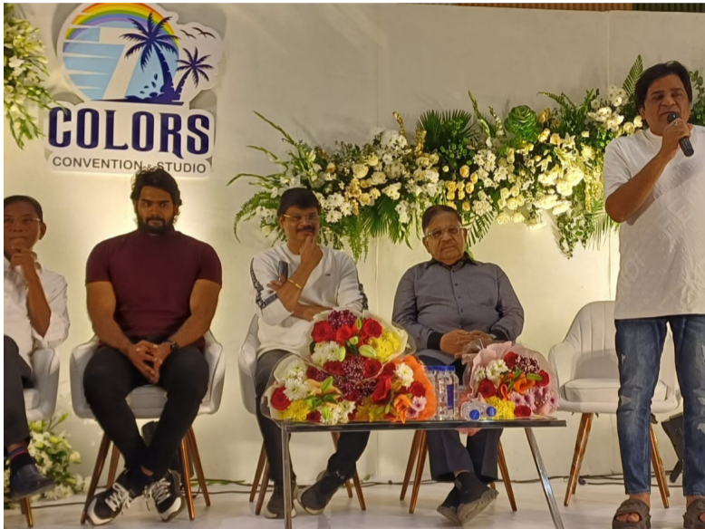
హైదరాబాద్, డిసెంబర్ 29, 2023: మరో ఉదయం