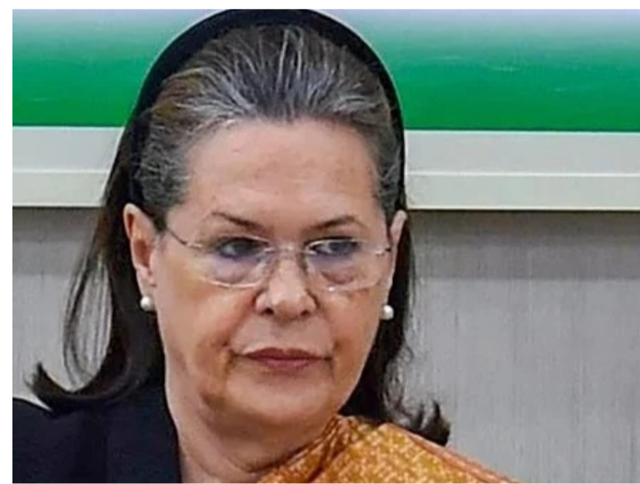
డిసెంబర్ 29 (మరో ఉదయం)