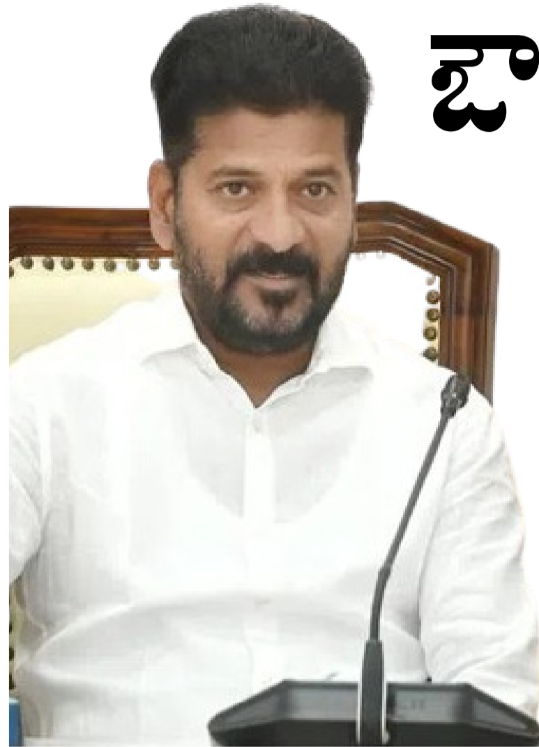
హైదరాబాద్, డిసెంబర్ 18 (మరో ఉదయం): నూతన పారిశ్రామిక వాడలను ఏర్పాటు చేసేందుకు టెటర్ రింగ్ రోడ్డు వెలుపల, రిజిస్టర్ రింగ్ రోడ్డు లోపల 500 నుండి 1000 ఎకరాల మేరకు భూములను గుర్తించాలని రాష్ట్ర ముఖ్యమంత్రి రేవంత్ రెడ్డి