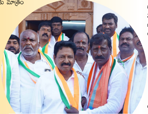
కాంగ్రెస్ లో చేరిన వారికి కండువాలూ కప్పి ఆహ్వానిస్తున్న దృశ్యం.

యాదయ్యతో పాటు మరి కొంతమందికి తాను లొంగకుండా ఉన్నందుకు తనపై కేసులు