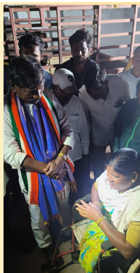
వికలాంగులారా సమస్య ఎంటున్న భీమ్ భరత్.