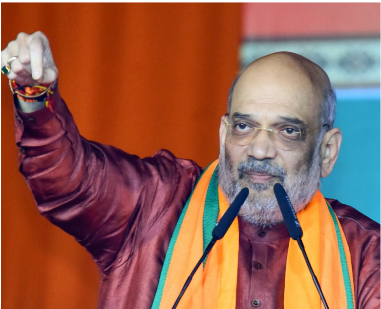
వల్ల ప్రజలకు చేరడం లేదని ఆరోపించారు. బీజెపి 2026 అసెంబ్లీ ఎన్నికల్లో మూడింట రెండు వంతుల మెజారిటీతో పశ్చిమబెంగాల్లో అధికారంలోకి వస్తుంది అమిత్ షా ధీమా వ్యక్తం చేశారు. ప్రజలు 2024 లోకసభ ఎన్నికల్లో బీజెపికి మద్దతు ఇవ్వాలని, తద్వారా

నుంచి 2014 డిసెంబర్ 31, అంతకంటే ముందు వచ్చిన హిందువులు, సిక్కులు, బౌద్ధులు, జైనులు, పార్సీలు, క్రైస్తీయన్ మైగ్రేంట్లకు పౌరసత్వం కల్పించేందుకు సీఎపి-2019 ఉద్దేశించింది. డిసెంబర్ 12న ఈ చట్టాన్ని నోడ్డి చేయగా, 2020 జనవరి 10 నుంచి అమల్లోకి వచ్చింది. పశ్చిమబెంగాల్ భవిష్యత్తుపై బీజెపికి స్పష్టమైన విజన్ ఉందని కోల్ కతా ర్యాలీలో అమిత్ షా తెలిపారు. పశ్చిమబెంగాల్ ప్రజలు 18 లోకసభ స్థానాలు, 77 స్థానాలు బీజెపికి ఇచ్చినందుకు కృతజ్ఞతలు తెలిపారు. బెంగాల్ అసెంబ్లీ నుంచి బీజెపి నేత నువేంద్ర అధికారిని న సెన్సైట్ చేసి ఉండవచ్చని, కానీ ప్రజల వాణిని అణగదొక్కలేదని అన్నారు. బెంగాల్ ప్రభుత్వాన్ని సాగునవుతామని ప్రజలంతా చెబుతున్నారని తెలిపారు. రాష్ట్ర సంక్షేమానికి ప్రధాన మంత్రి నరేంద్ర మోడీ పంపుతున్న నిధులు అధికార డీఎస్ షాకి