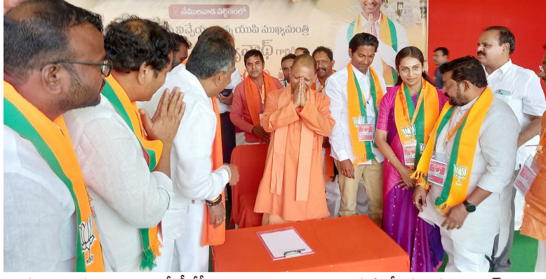
ఉందని అన్నారు. తెలంగాణలో బీజేపీ అధికారంలోకి తీసుకురావాలని.. తెలంగాణ విమోచన దినోత్సవం అధికారికంగా జరుపుకోవాలని స్పష్టం చేశారు. మోడీ నేతృత్వంలో నడుస్తున్న భారత ప్రభుత్వంపై ఏ దేశం కూడా కన్నెత్తి చూడలేదన్నారు. బీజేపీ అధికారంలో ఉంది కాబట్టే రాష్ట్ర మందిరం నిర్మాణం జరుగుతోందన్నారు. కాంగ్రెస్, బీఆర్ఎస్, బీఎస్పీ అందరి ఎజెండా ఒక్కటే అని చెప్పారు. సొంత రాష్ట్రం అయిన యూపీలోనే బీఎస్పీకి కేవలం ఒక సీటు మాత్రమే ఉందని యూపీ సీఎం యోగి ఆదిత్యనాథ్ పేర్కొన్నారు.