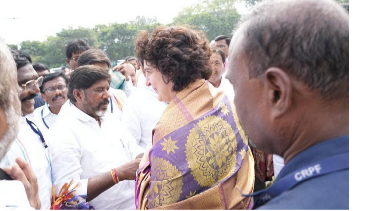
బీజేపీ, కేంద్ర ప్రభుత్వం సహకరిస్తోందని ఆరోపించారు. కేసీఆర్, బీజేపీని తరిమికొట్టాలని.. కేంద్రంలో బీజేపీని, మోడీని ఓడించాలని పిలుపునిచ్చారు. కేసీఆర్ తెలంగాణలో.. మోడీ డిప్లీలో రాజ్యమేలుతున్నారని అన్నారు. కారు టైరులు కాంగ్రెస్ పంచర్ చేసింది.. బీఆర్ఎస్ గాలి తీశారని.. డిప్లీకి వెళ్లి మోడీని పంచర్ చేస్తానని స్పష్టం చేశారు. ప్రజల తెలంగాణ తెచ్చుకుందామని రాహుల్ గాంధీ పిలుపునిచ్చారు.

కేసీఆర్ ప్రభుత్వంలో ఉన్న మంత్రులు దోపిడీదారులన్నారు. లిక్కర్ మాఫియా, భూదండం కేసీఆర్ కుటుంబంలో ఉందని రుయ్యబట్టారు. దళితబంధు, ఎస్సీ, ఎస్టీ సబ్ ఎ+ - లాన్ దారి మళ్లించారని ఆరోపించారు. వచ్చేది ప్రజల ప్రభుత్వమే అని స్పష్టం చేశారు. మొదటి క్యాబినెట్ మీటింగ్ లో ఆరు గ్యారంటీలు అమలు చేస్తామని హామీ ఇచ్చారు. బీజేపీ ఏ బిల్లు పెట్టినా కేసీఆర్ మద్దతు ఇచ్చారన్నారు. మూడు బిల్లులను తాను కళ్ళారా చూసినట్లు తెలిపారు. తెలంగాణ తన సొంత ఇల్లు అని పేర్కొన్నారు. కేసీఆర్ మీద ఒక్క కేసు పెట్టలేదని.. కేసీఆర్ కు