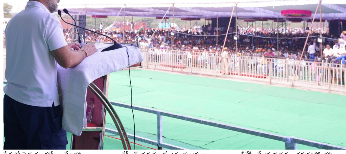
పేరుతో పెద్ద కుంభకోణం చేశారని మండిపడ్డారు. ధరకి పోర్లతో ఎమ్మెల్యేలకు భూములు అప్పగిస్తున్నారని రాహుల్ ఆరోపించారు. దొంగలకు, ప్రజలకు మధ్య యుద్ధం జరుగుతోందన్నారు. కాశీశ్వరంలో లక్ష కోట్ల కుంభకోణం జరిగిందన్నారు. పేదల కోసం కాంగ్రెస్ పోరాడుతుందని స్పష్టం చేశారు. మళ్ళీ అధికారంలోకి వస్తే భూములు గుంటుంటారని విమర్శించారు. కేసీఆర్ చదువుకున్న పాఠశాల కాంగ్రెస్ పార్టీ కట్టించే అని తెలిపారు. హైదరాబాద్ నగరాన్ని బట్టి నీటి చేసిన కాంగ్రెస్ అని.. మెట్రో కాంగ్రెస్ హయంలోనే వచ్చిందని చెప్పుకోవచ్చు.

తెలంగాణలో ఇక బిఆర్ఎస్ అవినీతి పాలన అంతం కాబోతున్నదని, బిజెపి, బిఆర్ఎస్ రెండూ తెలంగాణ డ్రోహ పార్టీలని అన్నారు. బోధనలో ఎన్నికల ప్రచారంలో కాంగ్రెస్ అగ్రనేత రాహుల్ గాంధీ పాల్గొన్నారు. ఈ సందర్భంగా అక్కడ ఏర్పాటు చేసిన బహిరంగ సభలో ఆయన మాట్లాడుతూ బీజేపీ, బీఆర్ఎస్ పై తీవ్ర విమర్శలు గుప్పించారు. బీజేపీ ప్రభుత్వం, సరేంద్ర మోడీ నల్లపట్టాలు చేసి రైతులను మోసం చేస్తున్నారన్నారు. నా పాదమెంటు సభ్యత్వం రద్దు చేశారు.. నాకు ప్రభుత్వం ఇందినీ తొలగించారని అన్నారు. సరేంద్ర మోడీ ప్రభుత్వానికి కేసీఆర్ అన్ని విధాలుగా సహకరిస్తున్నారని.. అక్కడ మోడీ.. ఇక్కడ కేసీఆర్ ఒకటే అని వ్యాఖ్యలు చేశారు. రాష్ట్రంలో కేసీఆర్ కారు పంచర్ అయ్యారన్నారు. రాష్ట్రంలో దొంగల పాలన కొనసాగుతోందని తెలిపారు. కాశీశ్వరం