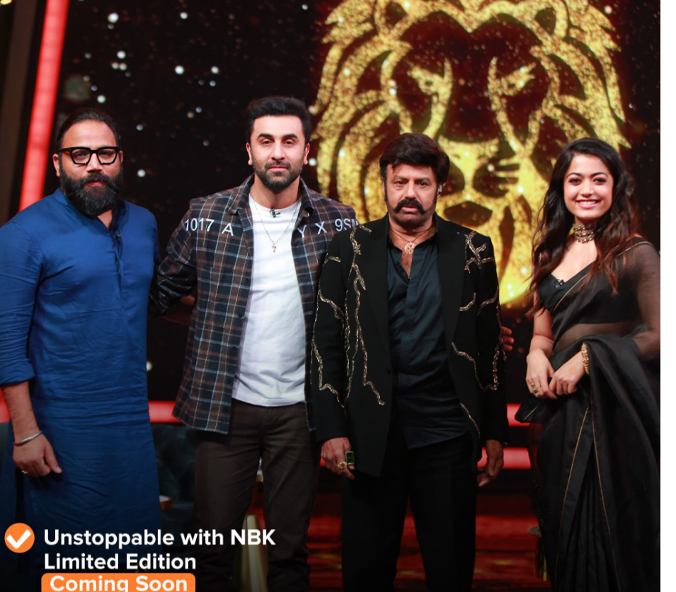
Unstoppable with NBK Limited Edition Coming Soon